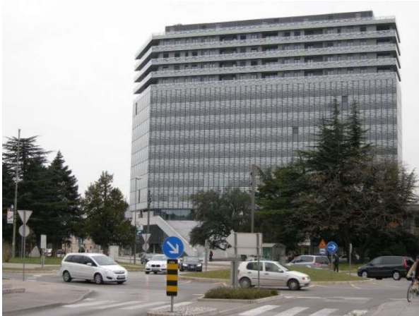
Slika 2: Stavba EDA center