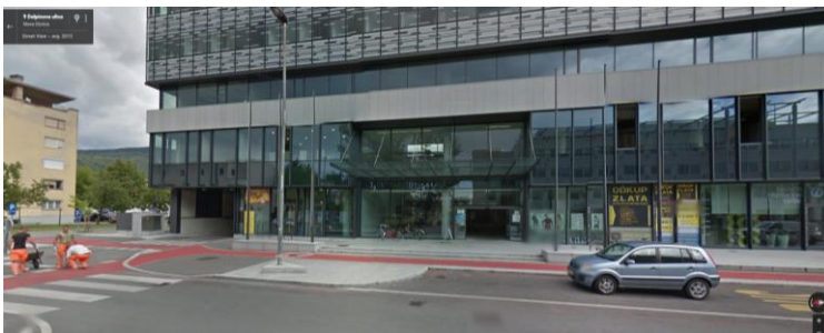
Slika 3: Pogled iz Delpinove ulice na vhod v garažno hišo, stavba EDA Center.